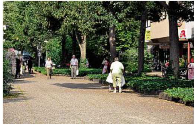
Im Bereich zwischen den Ladengeschäften soll eine Spielfläche mit Bewegungsgeräten für alle Altersgruppen entstehen