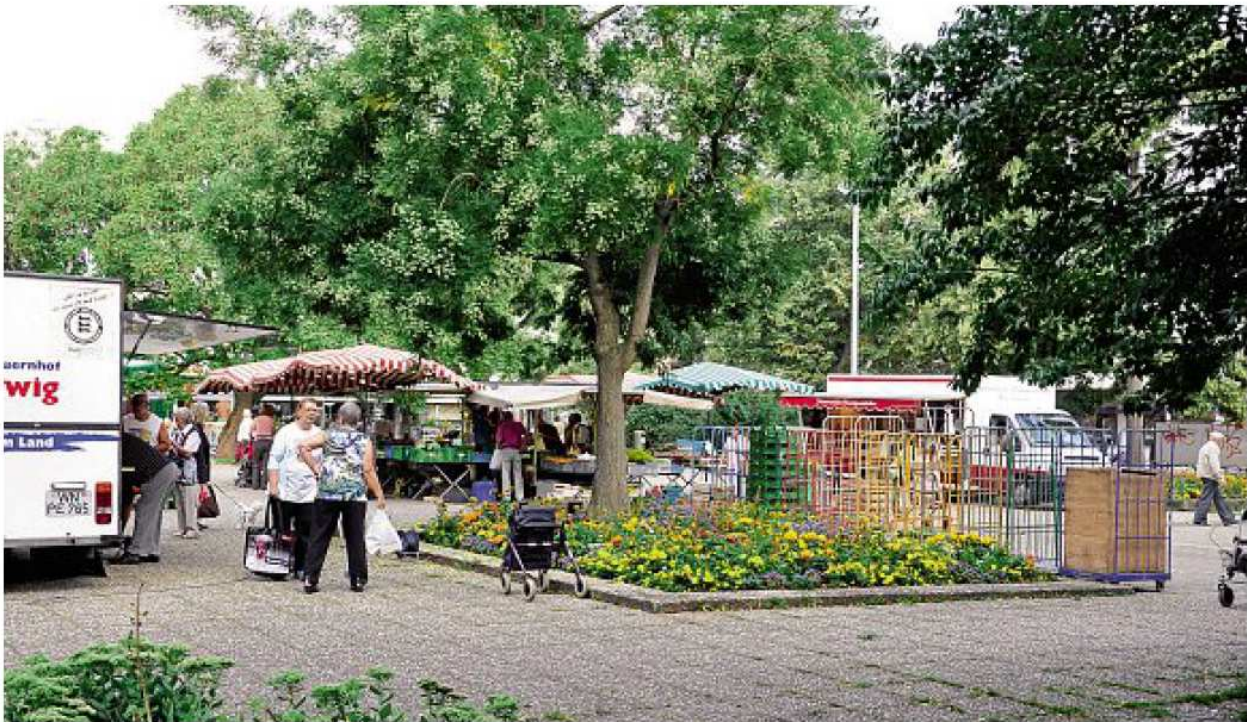
Der Ernst-Reuter-Platz wird auch nach seiner Umgestaltung Platz für den Wochenmarkt sowie Feste und andere Aktivitäten bieten

Die Umgestaltung des Ernst-Reuter-Platzes geht sozusagen auf die Zielgerade. Die Planungen sind abgeschlossen und auch alle notwendigen Gespräche mit den Eigentümern wurden geführt. Der Spatenstich wird im Herbst erfolgen.