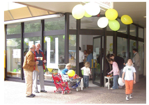
Öffentliches Bücherregal in Giebel eröffnet Breit gefächertes Angebot für Jung und Alt